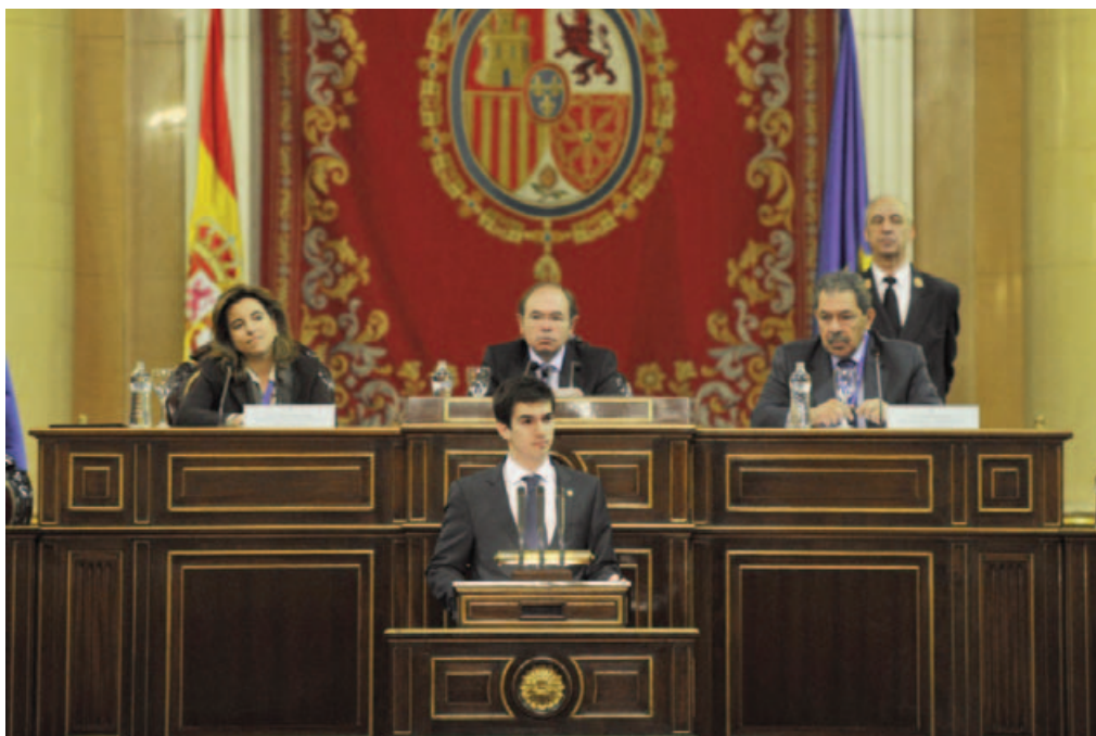
VI Encuentro SEKMUN. Jornada en el Senado.

La Presidencia convocará a tres delegados, que pueden pertenecer a una misma delegación o a diferentes delegaciones, para que presenten a discusión el anteproyecto de resolución. Estos delegados dispondrán del tiempo necesario para defender el anteproyecto, después se someterán a un máximo de cinco interpelaciones.